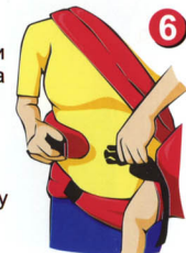
Рис. 6. Пристегните левую лямку в правый фастекс и отрегулируйте длину лямки так, чтобы было Вам удобно

Рис. 5. Возьмите левую лямку и оберните ее себе вокруг талии за спиной