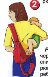
Рис. 4. Когда ножка ребенка уже просунута через рюкзачок, положите левую руку себе на спину, чтобы плотно прижать ребенка и спинку рюкзачка к себе. В это время поворачивайте ребенка так, чтобы он оказался по центру вашей спины.

Рис. 3. Одновременно с этим наклонитесь вперед и перенесите вес ребенка к себе на спину. Обратите внимание, что ножка ребенка должна быть под черной стропой, находящейся сбоку рюкзачка.