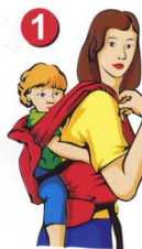
Рис. 1. Ослабьте плечевые лямки, увеличив длину боковой стропы. Расстегните соединительную стропу.

Рис. 2. Снимите с плеча правую лямку. Придерживайте лямку рукой.