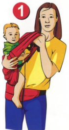
Рис. 1. Застегните поясной ремень, пропустив предварительно фастекс с «трезубцем» через страховочную резинку (фастекс «зацепится» за резинку). Поверните пояс так, чтобы рюкзак оказался у вас на правом боку. Посадите ребенка себе на правое бедро. Накиньте рюкзачок на спинку ребенка, поддерживая ребенка и рюкзачок правой рукой. Возьмите обе лямки в левую руку.

Рис. 2. Перенесите вес ребенка себе на спину, наклонившись вперед. Крепко держите лямки. Придерживайте ребенка правой рукой.