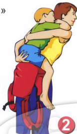
Рис. 2. Посадите ребенка себе «верхом» себе на спину.

1 Рис. 3. Когда ребенок сидит у Вас на спине, наклонитесь вперед и поддерживайте ребенка одной рукой, закинутой за спину, прижимая спину ребенка к своей спине. Свободной рукой возьмите ляжку рюкзака и поднимите спинку рюкзака на спину ребенка.