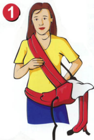
Рис. 1. Расстегните фастексы на обеих лямках. Положите рюкзачок внутренней стороной наверх. Для того, чтобы посадить ребенка на левое бедро, возьмите правую лямку и застегните в левый фастекс, пропустив предварительно через страховочную резинку. Перекиньте застегнутую лямку через правое плечо. Застегните поясной ремень, пропустив фастекс с «трезубцем» через страховочную резинку. Поверните пояс так, чтобы рюкзачок оказался на левом боку. Плотнo затяните пояс, потянув за свисающий конец стропы.