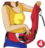
Рис. 4. Возьмитесь за капюшон одной рукой, придерживая второй рукой сложенные ляжки