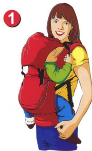
Рис. 1. Достаньте капюшон из кармашка и застегните фастексы, которые находятся на самом капюшоне и ляжках рюкзака.

! В бодрствующем состоянии дети, как правило, не любят, когда им надевают капюшон либо фиксируют головку.