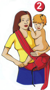
Рис. 2. Посадите ребенка в рюкзачок

Рис. 1. Расстегните фастексы на обеих лямках. Положите рюкзачок внутренней стороной наверх. Для того, чтобы посадить ребенка на левое бедро, возьмите правую лямку и застегните в левый фастекс, пропустив предварительно через страховочную резинку. Перекиньте застегнутую лямку через правое плечо. Застегните поясной ремень, пропустив фастекс с «трезубцем» через страховочную резинку. Поверните пояс так, чтобы рюкзачок оказался на левом боку. Плотнo затяните пояс, потянув за свисающий конец стропы.