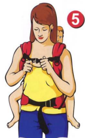
Рис. 5. Застегните соединительную стропу и отрегулируйте длину лямок

Рис. 4. Наденьте одну ляжку на плечо. Заведите руку за спину ребенка и поправьте рюкзачок так, чтобы ребенок находился строго по центру. Наденьте вторую ляжку себе на плечо.