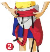
Рис. 2-3. Сложите ляжки рюкзака вдоль пояса. Сначала одну, затем вторую

1 Рис. 1. Застегните на себе пояс рюкзака. Спинка рюкзака при этом повиснет перед Вами.